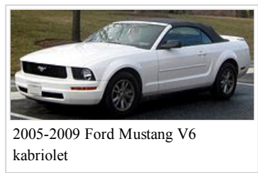
2005-2009 Ford Mustang V6 kabriolet

Zahájení výroby-up pro rok 2005 Mustang byl dne 7. září 2004, přičemž první 2005 modelem sjetí Flat Rock shromáždění dne 27. září 2004. USA uvedení na trh a zákazníci dodávky začaly na konci října 2004, se výroba končit pozdní 2008 pro model 2009. 2005-2009 se základna Mustang byl poháněn Ford blok z litiny 4.0 L Kolín nad Rýnem SOHC V6, který by nahradil 3.8 L Essex OHV V6 využívaných v roce 2004 a starší modely. To produkuje 210 koní (157 kW) při 5300 otáčkách za minutu a 240 lb · ft (325 N