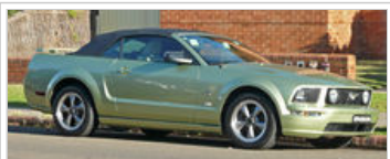
2005-2009 Ford Mustang GT konvertibilní