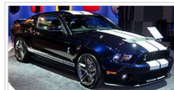
2.010 Shelby GT500

V roce 2010 Shelby GT500 byl odhalen Ford prostřednictvím tiskové zprávy k 1. lednu 2009, před veřejnou odhalení v roce 2009 North American International Auto Show. Mnoho základních konstrukčních vlastností nového GT500 jsou sdíleny s tím Mustang a Mustang GT. GT500 získává stejné exteriéru a interiéru aktualizace jako v roce 2010 Mustang a Mustang GT. Přední fascie je nového s většími horní a spodní mřížky, unikátní kapucí, velké mlhové světla namontovaná v dolní přední čelní plochou (podobně jako předchozí GT500), Shelby podpis Cobra odznaky na masky chladiče, přední blatníky a zavazadlového víkem medailon (s Shelby nápisy nad medailonu), 19-palcová kola (18 palců na kabriolet modelu), a Gurney Flap zadní spoiler. Uvnitř GT500 získává kobří disk na volantu, posunout míč, a sedadla s vyšívanými kobry. [67]