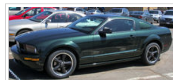
Ford Mustang Bullitt 2.008

Mustang Bullitt se vrátil v únoru 2008, varianta Mustang GT, poslední verze, která byla vyrobena v roce 2001. Je to pozůstatek z Dark Highland Green GT-390 Fastback Mustang vedený Steve McQueen v 1968 filmu Bullitt. K dispozici Dark Highland zelená nebo černá vnější nátěr bez spoileru a GT blatníku emblémy; vyrobená z imitace uzávěr plynu na víka zavazadlového prostoru je nahrazena unikátní Bullitt verzi. Mustang GT standardní mlhové světlo vybavené mřížka je nahrazen speciálně konstruované pony-méně stylu mřížkou zvýrazněné hliníkovou přízvukem. Tmavě Argent Gray 18-palcové lité hliníkové euro-příruby kola jsou používány s odpovídajícími brzdové třmeny a větší, 3,5 palcových koncovky výfuku nahradit standardní typy 3 palce Mustang GT. Ačkoli strana (čtvrtletí) okenní žaluzie (jak je znázorněno na obrázku) nejsou standardní, oni jsou přidány majitelé protože jsou podobné těm, které v roce 1968 Mustang Fastback.