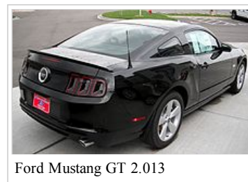
Ford Mustang GT 2.013

možnost Recaro sportovní sedadla přidány pro Coupe.