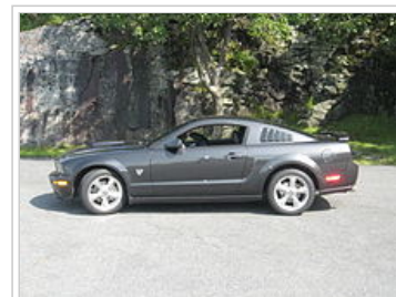
2.009 Mustang GT 45. výročí Edition (s vlastní čtvrtletí okenních žaluzií)

[30] Družicová bylo standardem u prémiových modelů interiéru, a Deluxe byl již používá pro identifikaci základních modelů. Tento model má stejný motor a funkční vybavení jako základní GT. V roce 2009 45. výročí vydání je badged s Mustang Colt emblém s logem 45. výročí. To zahrnovalo s volitelným kopečkem kapoty a leštěné nerezové oceli koncovky výfuku balíčku, zadní spoiler, osvětlení balíček Ambient byl nyní standard a součástí ceny vozidla bez dalších poplatků, a 17 "leštěný hliník kola byla volitelná (17" kola byly standard, ale tento model letos použit