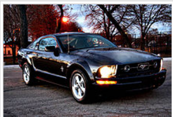
2.007 Ford Mustang V6 kupé s Pony balíčkem