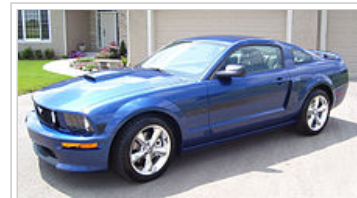
2.007 Ford Mustang GT / CS

V roce 2006, Ford představil GT California Special (GT / CS) balíček, hearkening zpět k původnímu 1968 Kalifornie Speciální Mustang. Balíček přidává 18 "leštěné alu kola, non-funkční postranní naběračky a jedinečný vinylovou pruhování, které nahradily boční GT emblémy. GT / CS také jiný přední čelní plochou a zadní záclonka s difuzorem, podobné těm, které najdete na Shelby GT . GT / CS Edition přední fascie byl 1,5 palce nižší k zemi než je standardní GT. aktualizace interiéru hotelu Mustang označené rohože, a CS pouze kožené barevné varianty interiéru. V roce 2007 GT Vzhled balíček přidává naběračku kapuce, výfukové typy, a kryt motoru.