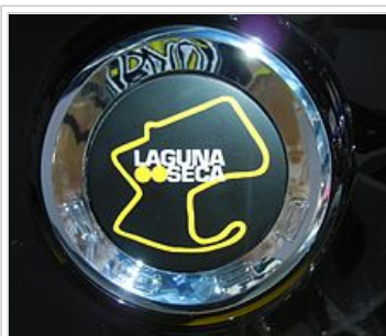
Laguna Seca edice má mapa stopy na zadní straně odznaku

Boss 302 Laguna Seca vydání je další modernizované verze Boss 302. Přírůstky zahrnují Recaro Sportovní sedadla, je Torsen samosvorný zadní diferenciál (oba nepovinné na standardní Boss 302), revidovaná závěsného ladění s unikátními jarních a tlumičů sazby, a větší zadní stabilizátor. Model Laguna Seca ztrácí zadních sedadel, které jsou nahrazeny cross-automobilu X-výztuhou pro zvýšení strukturální tuhost přibližně 10%. To vyjízďky na 19X9-palcový přední a zadní kola z lehkých slitin lehkých 19X10 palcové s ultra vysoce výkonných pneumatik R-sloučenina. Ford Racing přední brzdové potrubí pomáhají chladit brzdy.