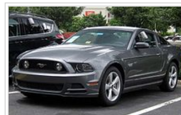
2.013 Ford Mustang GT 5.0 kupé

V letech 2009 a 2010, vývoj se konal o dalších změnách v druhé generaci S-197. Na konci roku 2010 projekční práce (Robert Gelardi) byl zmrazen, s prototypy se poprvé spatřen v květnu 2011. Dne 2. listopadu 2011, Ford představila 2013 modelový rok Mustang. Na rok 2013 modelový rok Mustang exteriér byl aktualizován s novou přední čelní plochou představovat větší mřížku, standardní HID světlomety a dvě LED zvýraznění pruhy sousedící s skle světlometu. Modely vybavené Pony balíček nabídl LED osvětlení namontovány na boční zrcadla, které produkují projekci běžícího koně na zem, 18 "koly, a nižších valence mlhových světel. V zadní části, LED zadní světlo clusteru zahrnutý sekvenční blinkry (stejně jako u 2010-2012 Mustangs) a reverzní kontrolka integrována do brzdové světlo. Víko zavazadlového prostoru zahrnutý černý panel, který spojila levé a pravé ocas lampy clusterů. Několik nové vzory kola byly nabídnuty.