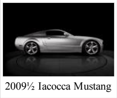
2009½ Iacocca Mustang