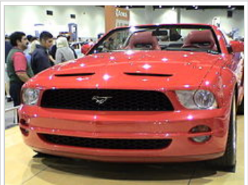
Pátá generace Mustang konvertibilní koncepce

Standardní vybavení na 2005 Mustang součástí elektrická okna, zdvojené napájecí zrcátka, centrální zamykání s dálkovým centrálním na DO, přední airbagy, AM / FM stereo s CD přehrávačem, 16-palcová maloval hliníková kola, a větších brzdových kotoučů, než předchozí generace Mustang s twin-třmeny vpředu. Některé z dostupných možností součástí Fordův MyColor (barevně konfigurovatelný panel přístrojů k dispozici jako součást vnitřní upgrade balíček), kartáčovaného hliníku panely (rovněž součástí vnitřní upgrade balíček), Ford Shaker 500 (500 watt peak výstup), nebo Shaker 1.000 (1000 watt peak výstup) prémiový audio systém s 6 disků MP3-kompatibilní CD měnič, kožené sedací plochy, šest-cesta sedadlo síla nastavitelné řidiče, a čtyřkanálový protiblokovací brzdový systém s kontrolou trakce (standard na GT modely). [16] Všechny Mustang GT a Convertibles přišel s zadní houpat barem s bílými odkazy v těchto letech; průměr bar měnit s možnostmi a byl 18 mm, 19 mm, 20 mm, nebo 22,4 mm. Náhradní odkazy z Ford skupin jsou černé nebo oxid potažené [17]